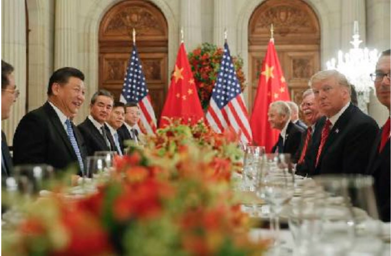
Cuộc họp Mỹ-Trung tại Buenos Aires, 2019.

Một sự kiện nổi bật đáng ghi nhận: Tập thổ lộ ông ta muốn làm việc với Trump sáu năm nữa. Trump trả lời rằng nhiều người nói điều luật giới hạn hai nhiệm kỳ tổng thống nên được bãi bỏ đối với ông. Tập than nước Mỹ sao có nhiều bầu cử quá, mà ông ta thì không muốn đổi qua làm việc với người khác. Trump gật gù tán thành.