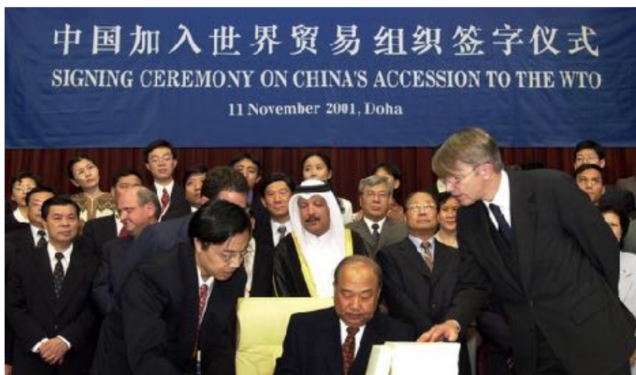
Trung Quốc chính thức gia nhập WTO

đã chơi khăm WTO bằng cách theo đuổi một chính sách kinh tế quốc doanh biến dạng, núp bóng một tổ chức mậu dịch tự do. Họ ăn cắp tài sản trí tuệ của người khác; buộc công ty ngoại quốc phải chuyển giao công nghệ cho mình; và tiếp tục quản lý nền kinh tế theo kiểu độc tài.