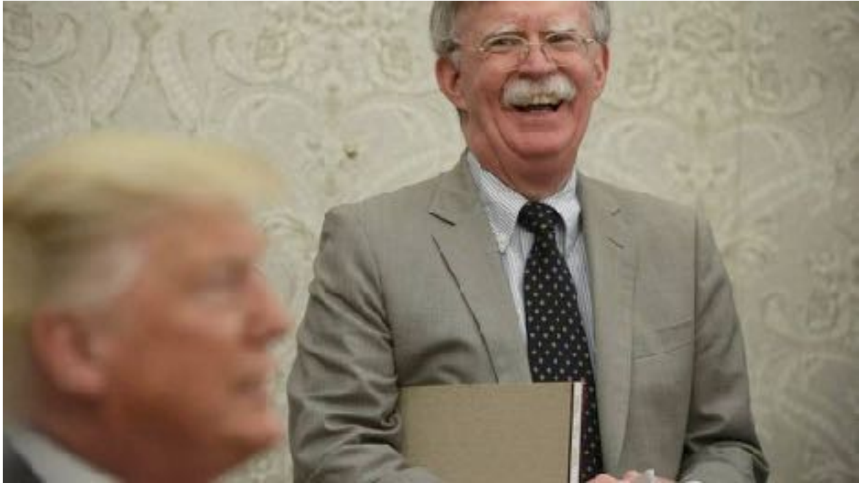
John Bolton và TT Trump

Chiến lược của Hoa Kỳ đối với Trung Quốc trong hơn bốn thập niên qua được dựa trên hai mệnh đề cơ bản. Thứ nhất là nền kinh tế Trung Quốc sẽ thay đổi và không thể đảo ngược bởi sự thịnh vượng ngày một gia tăng do các chính sách thiên thị trường tự do, đầu tư nước ngoài ngày càng nhiều, sự kết nối với thị trường toàn cầu ngày càng sâu sắc, và các chuẩn mực kinh tế quốc tế sẽ ăn sâu vào hệ thống. Cho phép Trung Quốc gia nhập WTO (Tổ chức Thương mại Thế giới) năm 2001 là hiện thực của ý tưởng này.