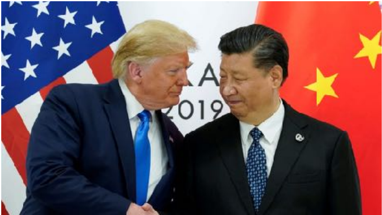
Trump & Tập tại G20, Osaka 2019

Trong cuộc họp tại Osaka ngày 29 tháng 6, Tập nói với Trump rằng mối quan hệ Mỹ-Trung là quan trọng nhất trên thế giới. Ông ta nói một số chính khách Mỹ (không đưa tên) có những phán đoán sai lầm khi họ kêu gọi một cuộc chiến tranh lạnh mới với Trung Quốc.